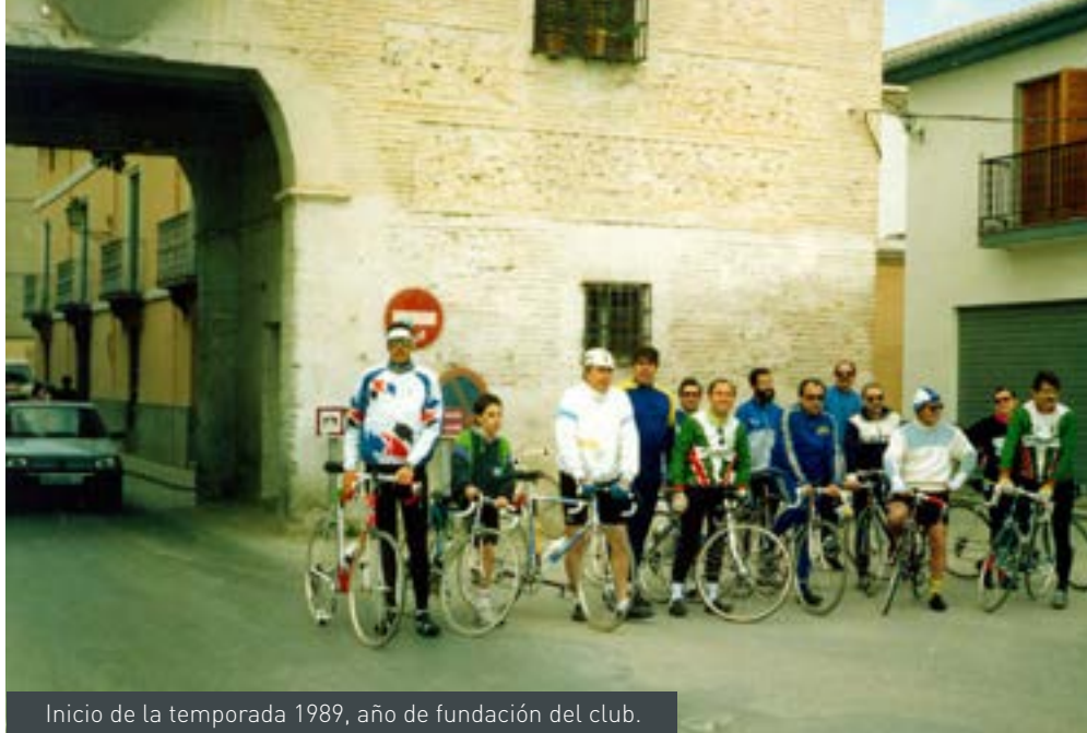
Inicio de la temporada 1989, año de fundación del club.

noveles que se nos unen, hemos preparado unas salidas especiales de inicio de temporada más suaves y con paso por localidades de la vega que los ciclistas frecuentan con asiduidad, de tal forma que sirvan de acicate no solo a estos grupos, sino también a todos aquellos que se encuentran bajos de forma y que deseamos que se vayan incorporando poco a poco al ritmo de los más preparados.