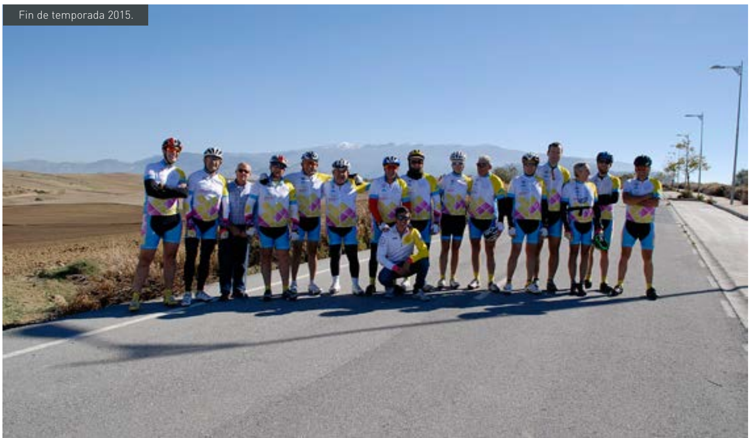
Fin de temporada 2015.

Este año en apoyo y reconocimiento de nuestros mayores así como para acoger a los ciclistas